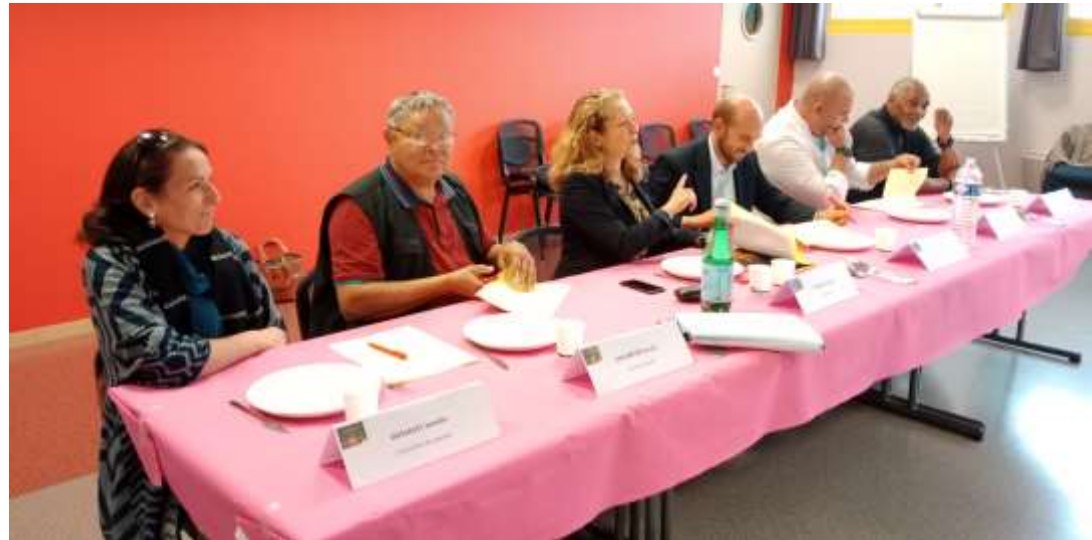
Jury du Concours de cuisine à la Grâce de Dieu – Edition 2022