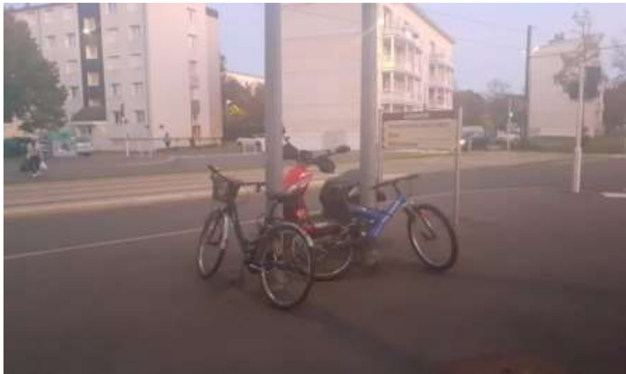
Stationnement sécurisé des 2 roues