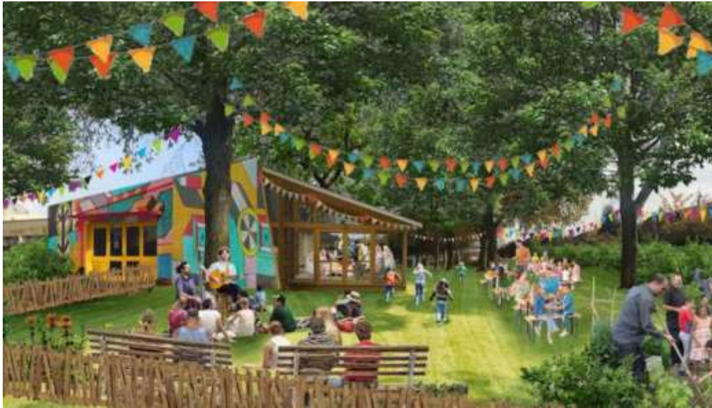
Tiers-lieu rive droite, ouvert à tous