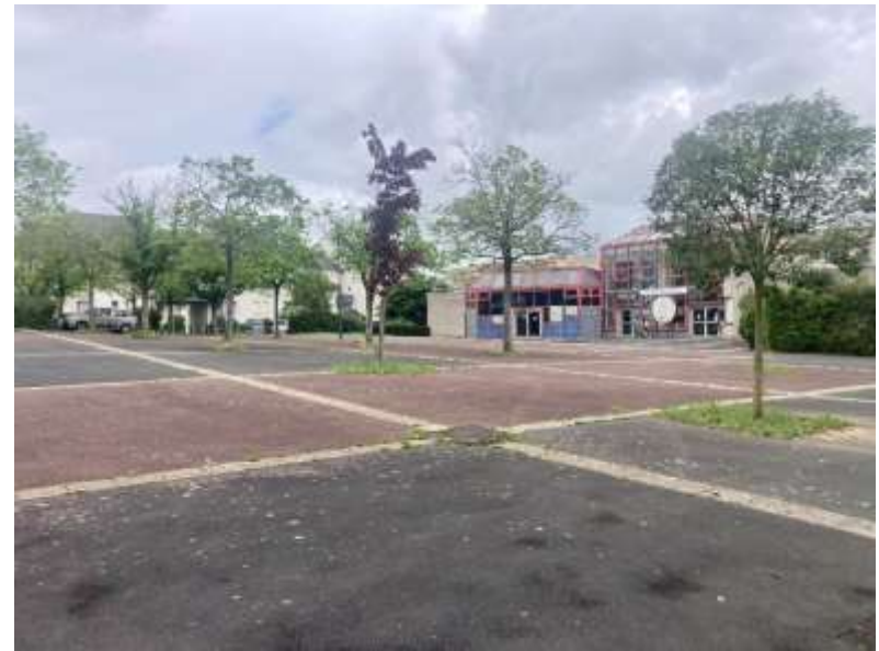
Végétalisation de l'esplanade Malraux