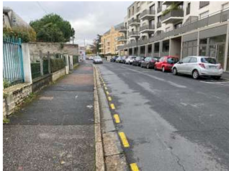
Améliorer la circulation des vélos rue Verte Vallée