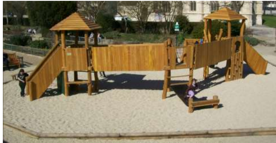
Aménagement espace végétal rue des Tisserands