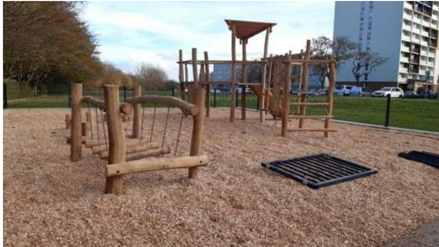
Espace convivial et sportif rue de Champagne