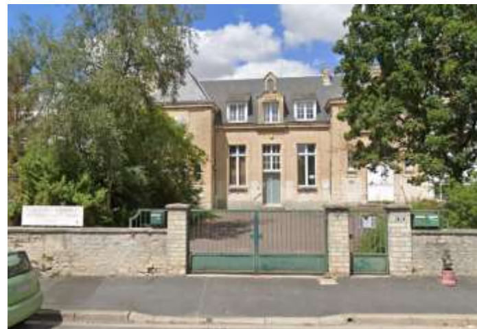
La Recyclette de Venoux - Beaulieu