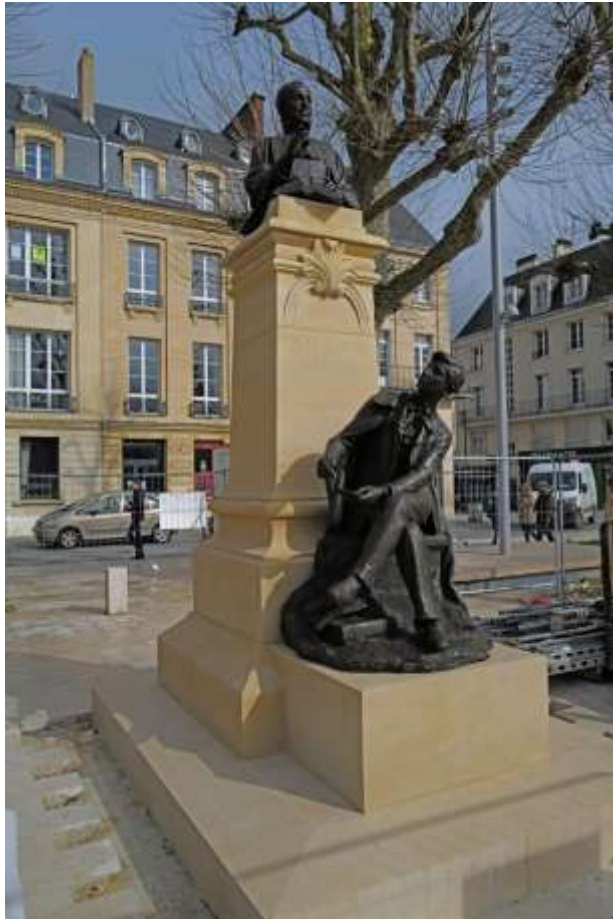
Statue de Demolombe place de la République