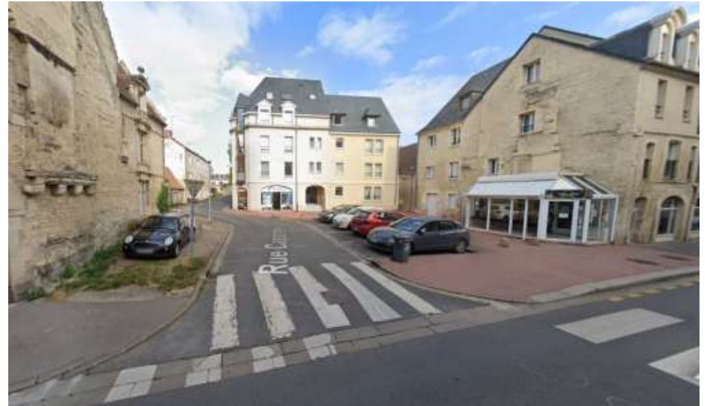
Oasis de fraîcheur, rue Caponière