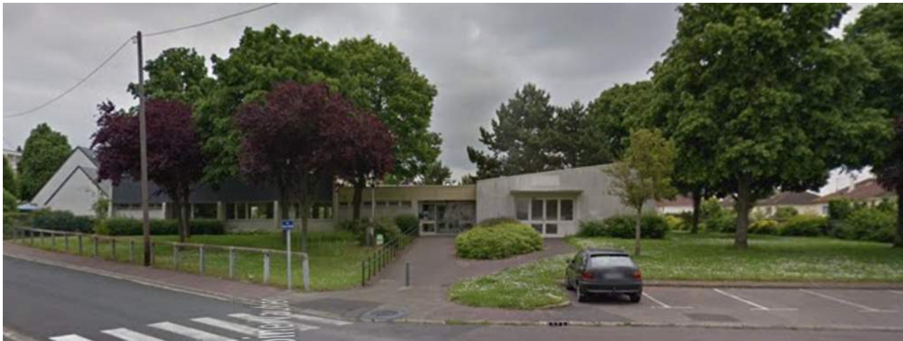
Un bâtiment peu identifié, des espaces verts non aménagés

Nous sommes désormais dans l'aile droite de la Maison de Quartier. La Maison de Quartier Sainte Thérèse, aujourd'hui, c'est cela :