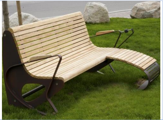
Transats ou bains de soleil pour lire les livres empruntés à la bibliothèque de l'espace Malraux