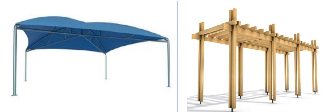
Autres exemples en toile ou en bois