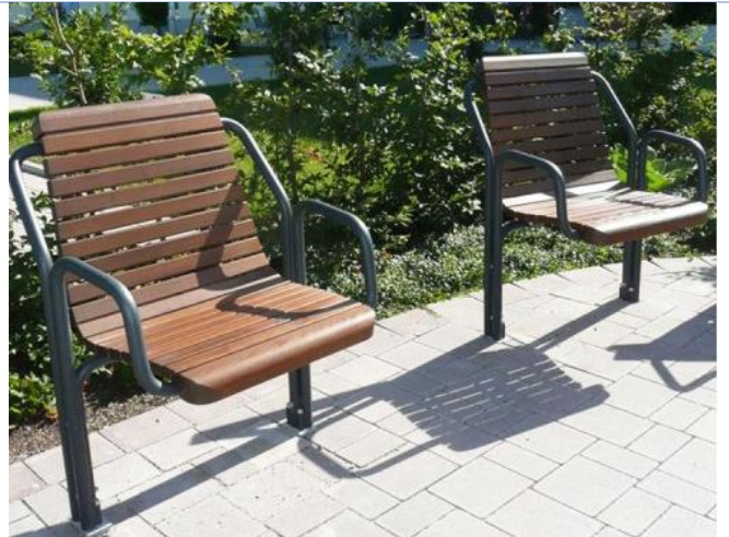
Bancs et fauteuils seniors