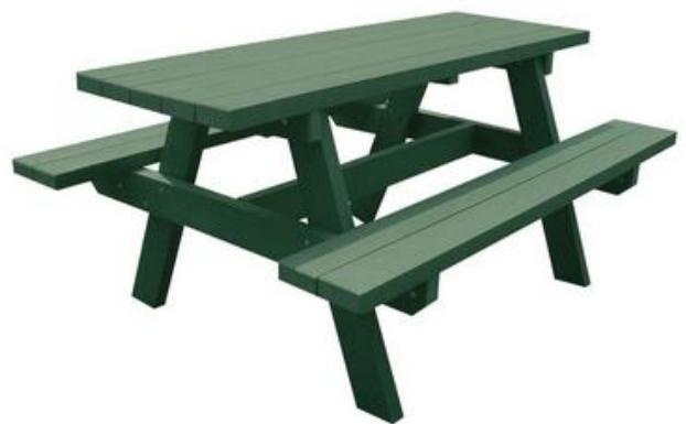
Tables de jeux ou de pique-nique