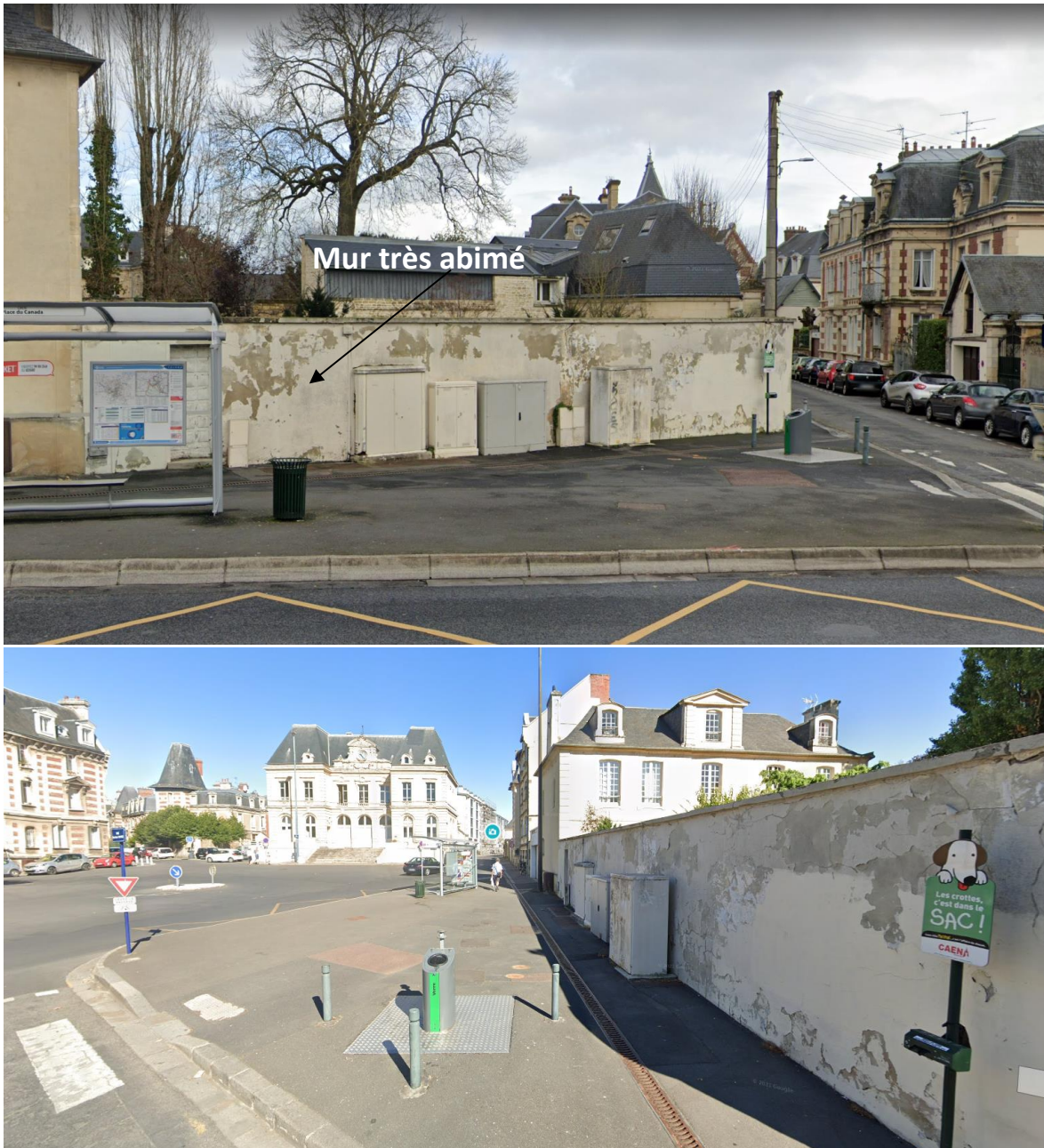
Figures 8 et 9 – Côté de la Place du Canada avec un arrêt de bus – Vue « Street View »

Sur ce côté de la Place du Canada, le mur est assez détérioré. Simplement le repeindre permettrait d’embellir cette place.