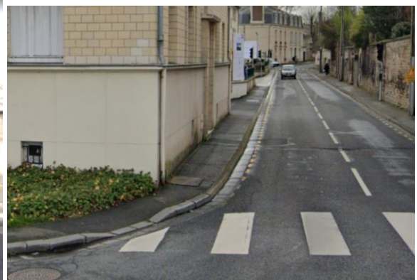
Figures 6 et 7 – Passage piéton Rue Barbey d'Aurevilly – Vue « Street View » - © Google Maps - 2021