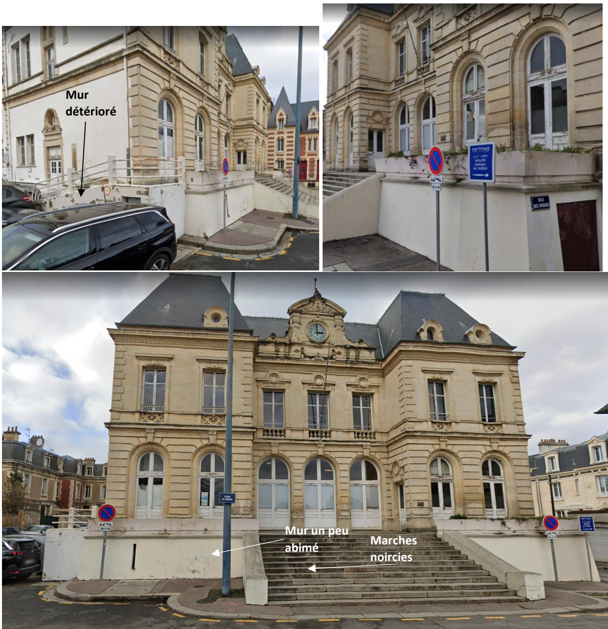
Figures 3, 4 et 5 – Ancienne gare Saint Martin – Vue « Street View » - © Google Maps - 2021