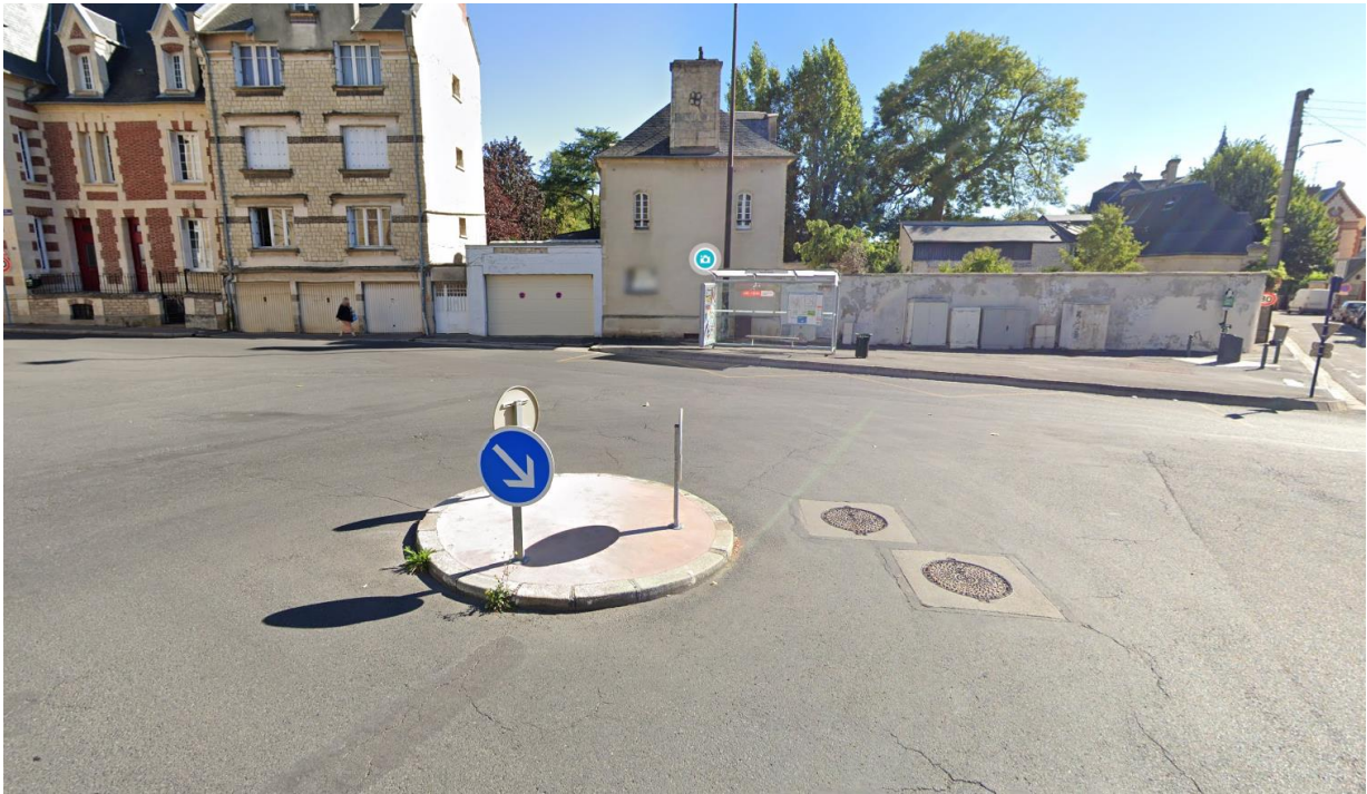
Figure 10 – Rond-point de la Place du Canada – Vue « Street View » - © Google Maps - 2021

Actuellement, le rond-point est assez basique.